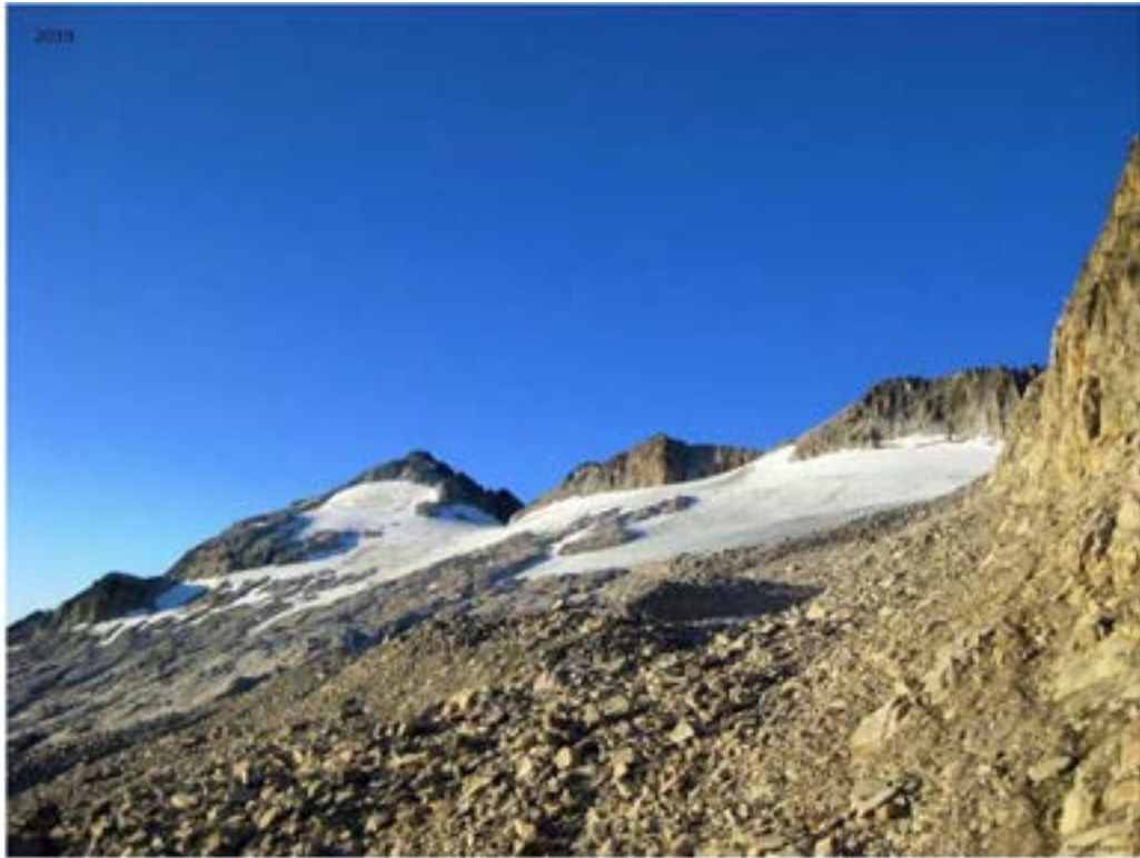
Markatu aukera bakarra.