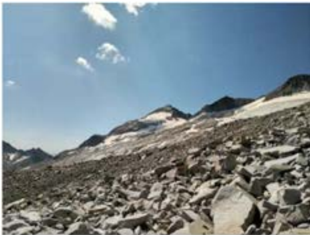
Markatu aukera bakarra.