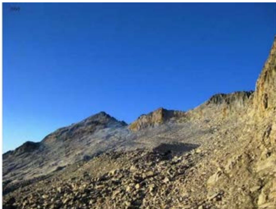
Markatu aukera bakarra.