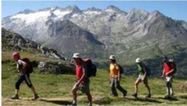
Markatu aukera bakarra.