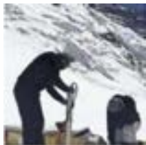
Markatu aukera bakarra.