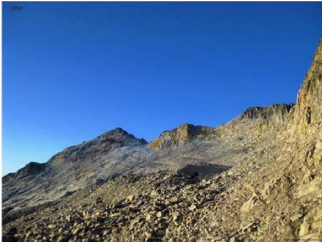
Markatu aukera bakarra.