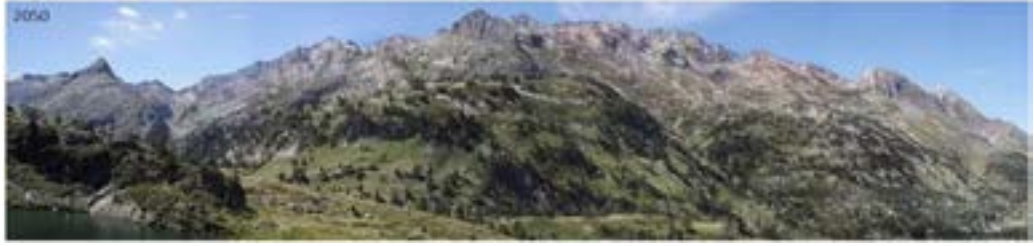
Markatu aukera bakarra.