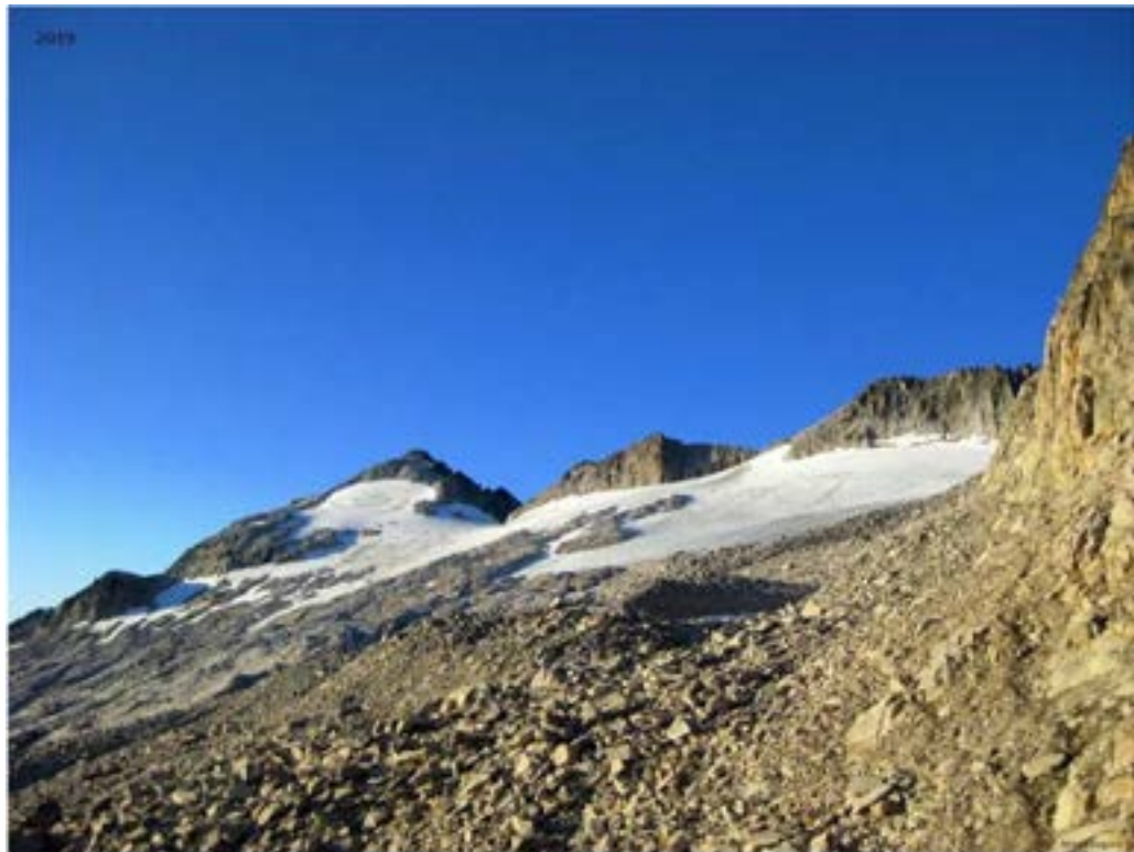
Panorámica del valle de Benasque en 2019