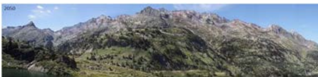
Markatu aukera bakarra.