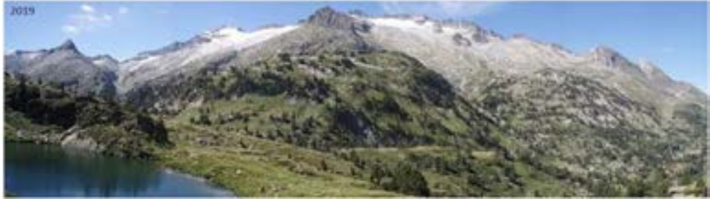
Markatu aukera bakarra.